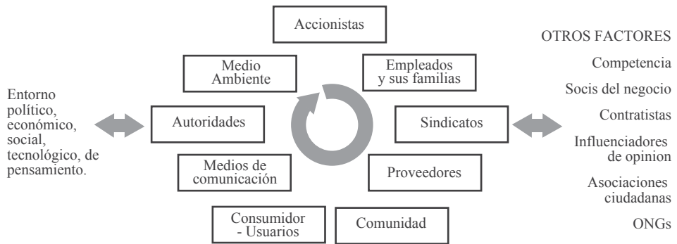
Figura 3: Radio de acción de los multistakeholders .