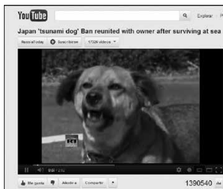
Figura 1: valores noticia y medios sociales.

En los nuevos medios la respuesta social a los mensajes introduce otro tipo de matices. Según el citado estudio de Rosenstiel y Mitchell (2012) un mes después del tsunami que afectó a Japón (2011), obtuvo gran popularidad un vídeo que mostraba la reunión de una mascota con su dueño (figura 1). Ingresan nuevos parámetros de cobertura en la medida en que testigos, webcams situadas en lugares públicos y organizaciones informativas se constituyen en fuentes de la noticia y el material audiovisual, muchas veces en bruto, ganando protagonismo.